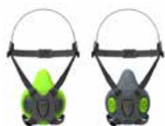
Respiradores semi faciales BLS 4000 S - BLS 4000 R