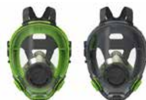
Respiradores de cara completa BLS 5700 - BLS 5600