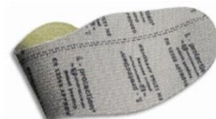
Plantilla anti-perforación flexible