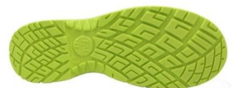
Suela Antiestática + Resistente a los hidrocarburos