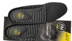
Plantillas extraíbles. Lavables