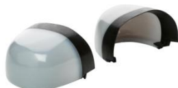
Puntera no metálica